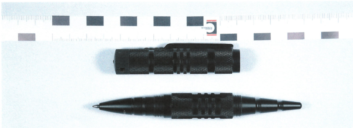
Abbildung 2: „Tactical Pen“, Modell „COP Spen Mk. II“, Ansicht auseinandergeschraubt

Das untere Gehäuseteil hat auf der einen Seite eine Kubotangestaltung und auf der anderen Seite eine Kugelschreibermine. Das Gehäuseteil ist so gestaltet, dass es mit jeder der beiden Seiten in das obere Gehäuseteil eingeschraubt werden kann. So stellt der „Tactical Pen“, Modell „COP Spen Mk. II“ einmal einen Kugelschreiber und das andere Mal einen Kubotan dar.